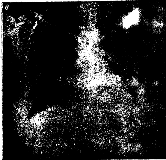
Şekil 1. Hastanın tedavi öncesi PA akciğer grafisi.

Hastanın 23/11/1994 tarihli postero-anterior akciğer grafisinde her iki akciğerde orta ve alt zonlarında homojen olmaya meyilli fakat heterojen radyoopasite artımı gözlemlendi. Sağ üst zonda 0,5x0,5 cm ve 1x1cm boyutlarında sınırları düzensiz radyoopasite artımları gözlemlendi (Şekil 1).