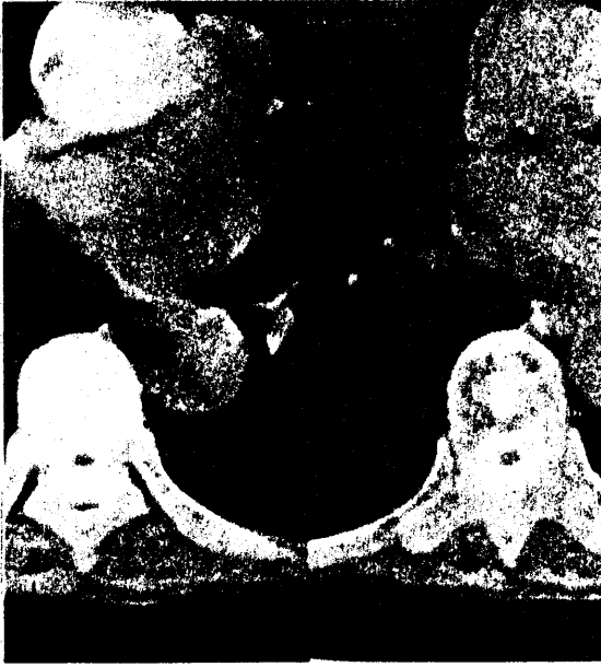
Şekil 1-Myelo-BT'de orta torakal bölgede kordun hacimce azaldığı ve atrofik hale geldiği görülmektedir.

bağlı miyelomalasi görülür. Lezyonlar medulla spinaliste birkaç segmentte yerleşir. Genel olarak spinal arterlerin tıkanmalarına göre değişen motor ve duyu bozuklukları meydana gelir (8,11). Spinal kord atrofisi olguları üç klinik tablo şeklinde ortaya çıkar. Bunlar diffüz (transvers myelopati), anterior spinal arter sendromu ve Brown-Sequard sendromu şeklindedir (12). Buradan anlaşıldığı gibi spinal arter tıkanmaları ve spinal kord atrofisi olguları benzer semptomlara neden olmaktadır. İncelenen sekiz olguda semptomlar transvers myelopati şeklinde ortaya çıktı.